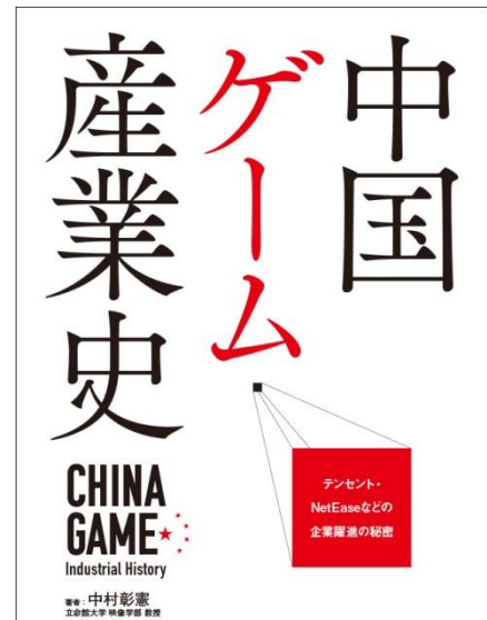
▲『中国ゲーム産業史』表紙